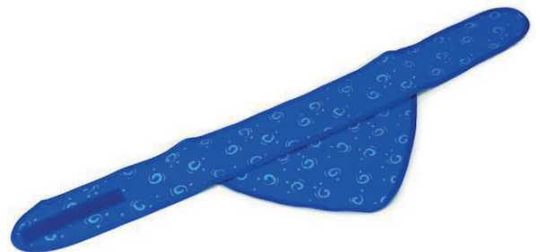
Bandana's en halsbanden